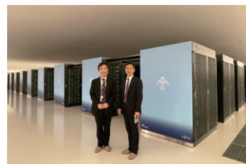
スーパーコンピューター富岳を 視察