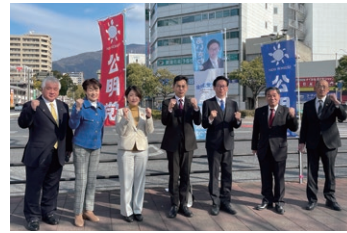
呉市の公明党新春街頭から出発