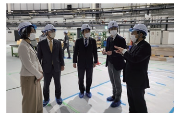
東北大学にてNanoTerasuを 視察