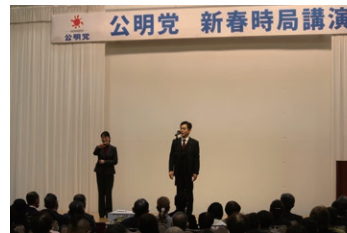
公明党岡山県本部 新春時局講演会にて挨拶