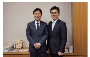
林始興 駐広島大韓民国総領事と 議員会館にて