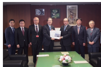
松井一寛 広島市長と国交大臣へ 申し入れ