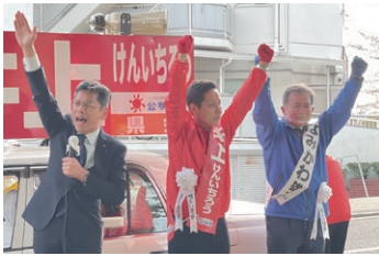
統一地方選挙 広島市中区で 応援演説