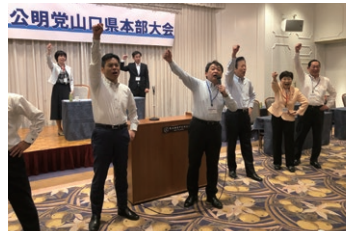
臨時公明党山口県本部大会にて 勝どき