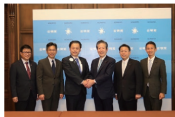
丸山達也 島根県知事を 公明党本部で迎える