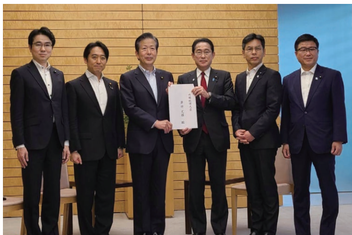
公明党 核廃絶委員会 総理申し入れ

皆様の絶大なるご支援により、この春の統一地方選挙で公明党は大勝利させて頂きました。大変、ありがとうございました。これにより世代交代が進み、女性議員も多く誕生。各県本部も新体制で出発させて頂きました。私自身、2021年10月に初当選させて頂いて以来、2度目の通常国会を経験。所属する法務委員会、文部科学委員会、原子力問題調査特別委員会だけでなく、予算委員会にも初めて質問に立たさせて頂きました。ご心配をおかけしているマイナンバーについても、安心と信頼を最優先に進めて参ります。大学等の研究者も継続して支援しており、日本の科学技術の発展の為に一層の取り組みを進めて参ります。今後ともご指導のほど、よろしくお願い致します。