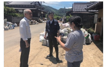
大雨で浸水被害に遭った美祢市 を見舞う