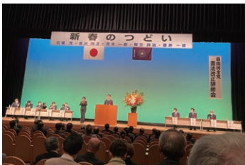
鳥取県自民党 新春の集いにて 友党挨拶