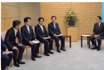
首相官邸にて岸田総理に 核廃絶を訴える