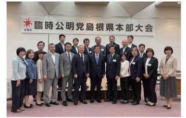
臨時公明党島根県本部大会にて 記念撮影