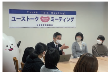
出雲市のユーストークミーティング で意見交換